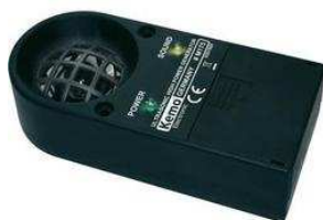
Ultrazvukový odpuzovač zvířat obj. č. 672108

Zařízení se připojuje k ultrazvukovému odpuzovači zvířat